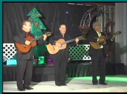
Trio Los Arubeños cu presentacion di Pasco